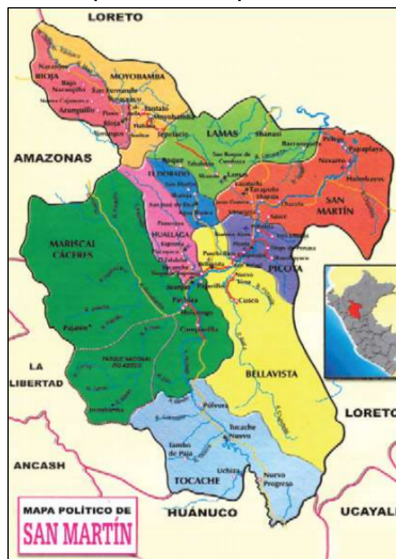
GRÁFICO 01: Mapa Político del departamento de San Martín

Distinguiéndose 4 zonas morfológicas: la parte occidental limita con la vertiente oriental de la cordillera de los Andes y presenta topografía accidentada; la zona de valles amplios con presencia de terrazas escalonadas, formadas por el río Huallaga y sus afluentes, la cual tiene aptitud agropecuaria por excelencia; la zona sur-este con un relieve que es continuación de la llamada "Cordillera Azul" tiene poca elevación pues sus cumbres no sobrepasan los 3 000 msnm.; y finalmente, la zona no-este, poco accidentada, corresponde a la selva baja. San Martín está dividido en 10 provincias y 77 distritos.